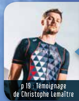
p 19 : Témoignage de Christophe Lemaître

HARCÈLEMENT SCOLAIRE : LES JEUNES S'ENGAGENT