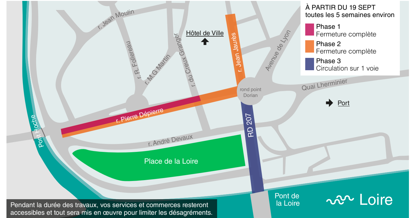
Pendant la durée des travaux, vos services et commerces resteront accessibles et tout sera mis en œuvre pour limiter les désagréments.

Dans le secteur de la rue Jean Moulin, à la demande du Maire, près de 90 places vont être matérialisées. Si certaines ont déjà été créées, les autres le seront à la fin de la construction des résidences en cours de réalisation. En effet, des rues adjacentes doivent être mises en sens unique pour permettre la création des nouvelles places sur la voirie. L'ensemble de ce stationnement sera gratuit !