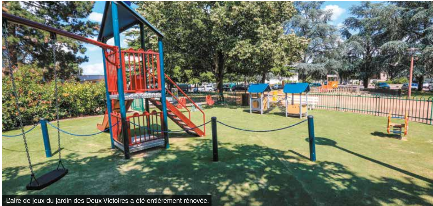
L'aire de jeux du jardin des Deux Victoires a été entièrement rénovée.