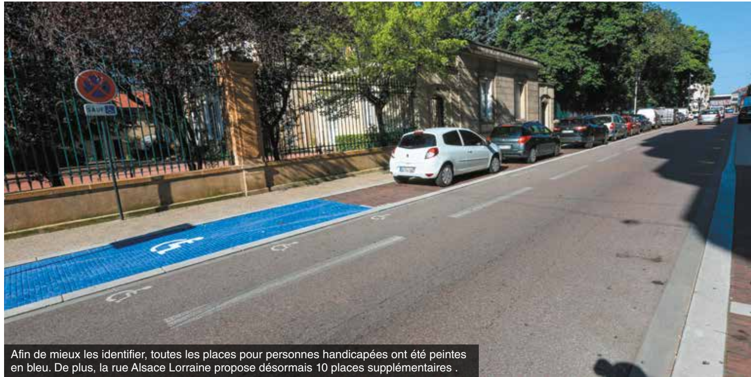
Afin de mieux les identifier, toutes les places pour personnes handicapées ont été peintes en bleu. De plus, la rue Alsace Lorraine propose désormais 10 places supplémentaires.