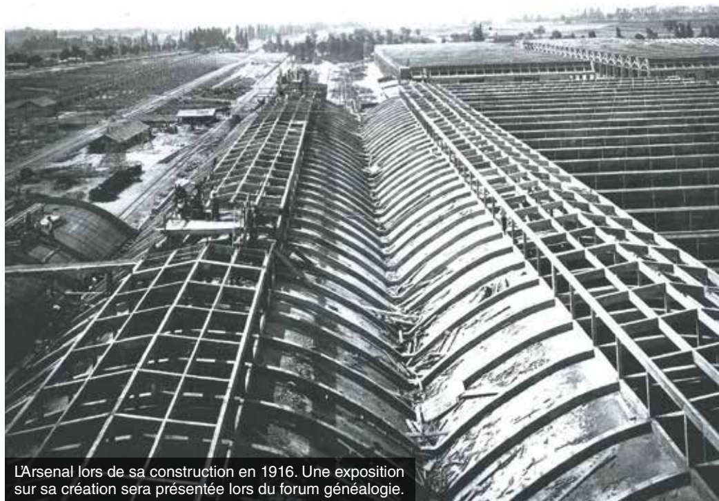
L'Arsenal lors de sa construction en 1916. Une exposition sur sa création sera présentée lors du forum généalogie.

Suite au décès de la romancière et essayiste française Benoîte Groult survenu le 20 juin, Yves Nicolin et l'ensemble du conseil municipal saluent la mémoire de la citoyenne d'honneur de la Ville de Roanne. Celle qui fut tout au long de sa vie une figure du féminisme français laisse une œuvre littéraire importante et un beau message à ses lecteurs, « avoir un goût forcené pour la vie ».