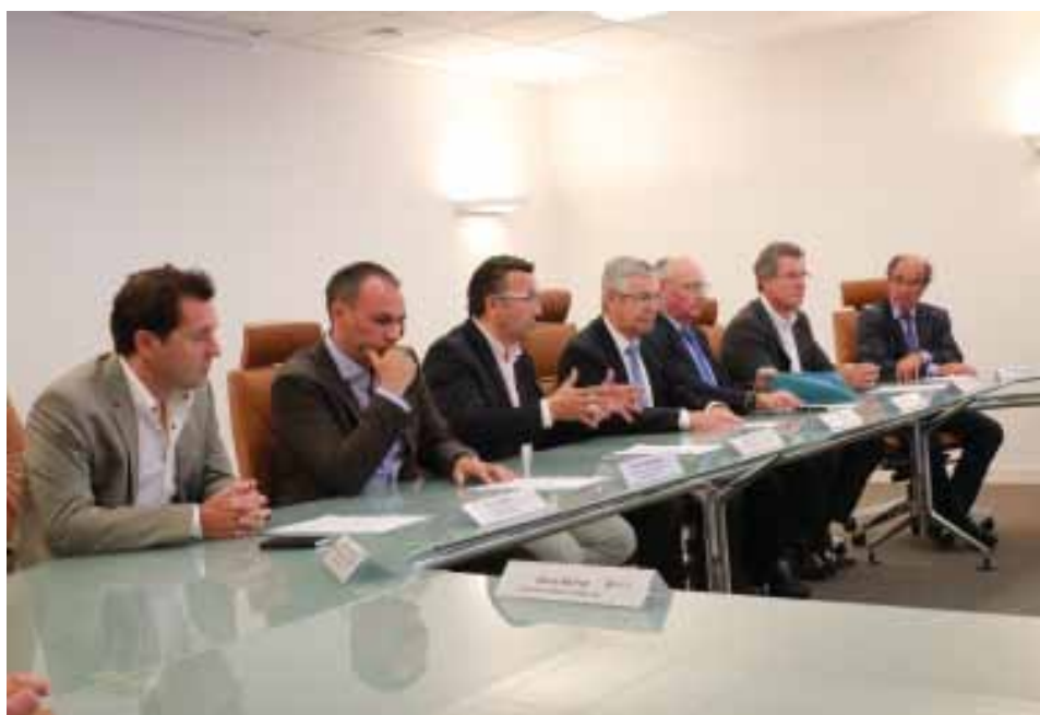
Les acteurs institutionnels se sont mobilisés pour le développement d'AC Environnement dans le Roannais.

Le 27 juin dernier, le groupe AC environnement, spécialiste des diagnostics immobiliers, a annoncé sa décision de s'installer sur la ZA de Beaucueil à Riorges. 120 emplois seront créés à l'horizon 2017. Cette annonce est le fruit d'une mobilisation de tous les partenaires institutionnels du territoire. L'aide à l'immobilier d'entreprise mise en place par Yves Nicolin à Roannais Agglomération a notamment été déterminante dans le choix final de l'entreprise.