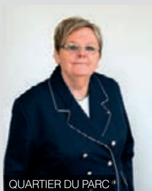
QUARTIER DU PARC

Tous les 1 ers samedis du mois de 10h à 12h