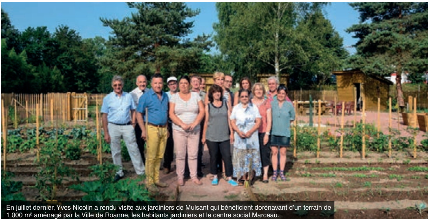
En juillet dernier, Yves Nicolin a rendu visite aux jardiniers de Mulsant qui bénéficient dorénavant d'un terrain de 1 000 m 2 aménagé par la Ville de Roanne, les habitants jardiniers et le centre social Marceau.