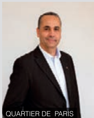
QUARTIER DE PARIS

Tous les 1 ers mardis du mois de 17h à 19h