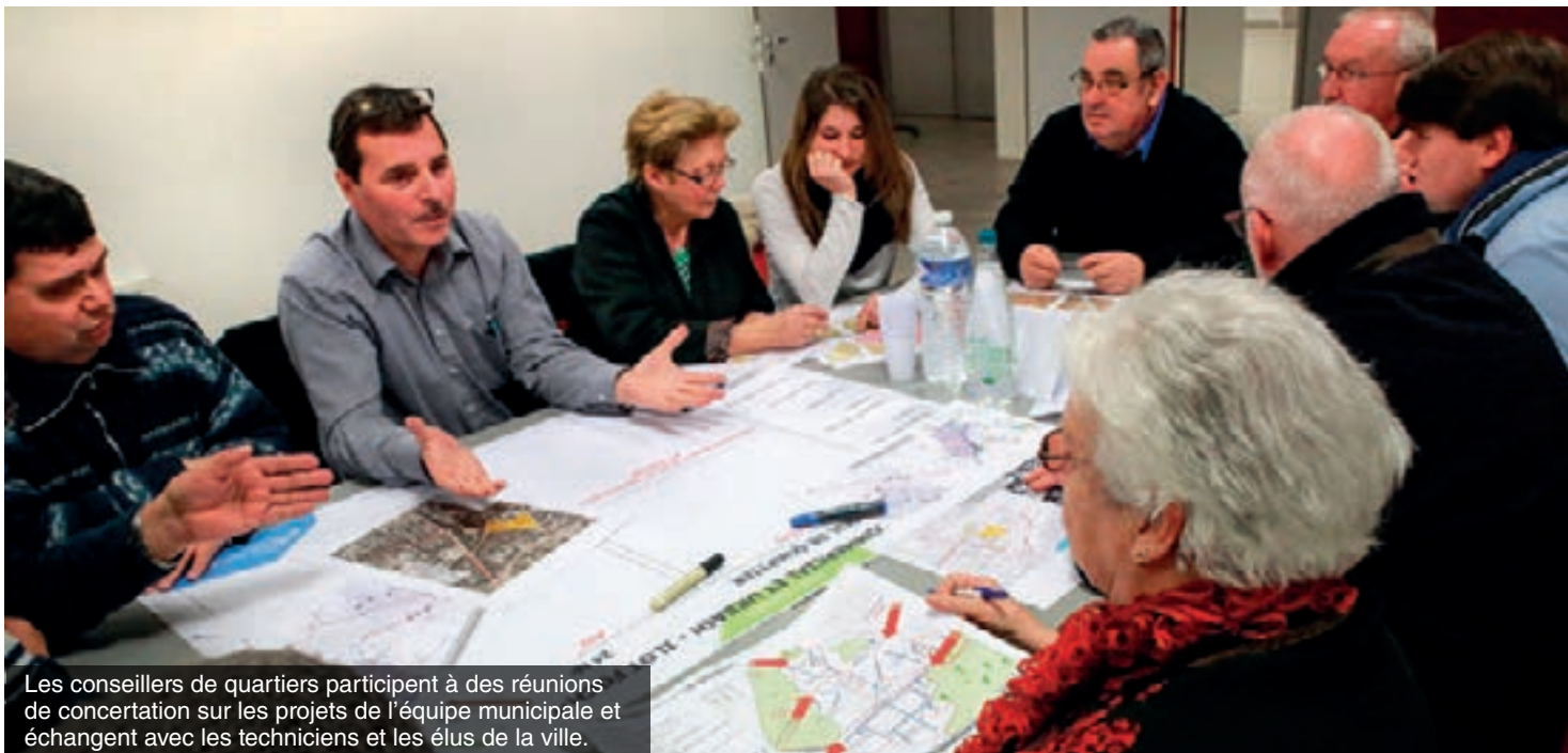
Les conseillers de quartiers participent à des réunions de concertation sur les projets de l'équipe municipale et échangent avec les techniciens et les élus de la ville.