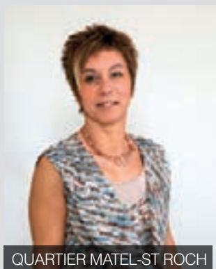
QUARTIER MATEL-ST ROCH

Pour connaître les autres dates 04 77 23 20 18