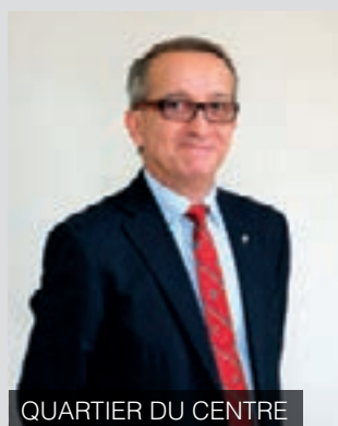
QUARTIER DU CENTRE