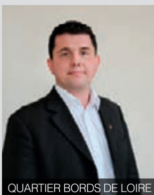
QUARTIER BORDS DE LOIRE

Tous les 1 ers mardis du mois de 15h30 à 17h30