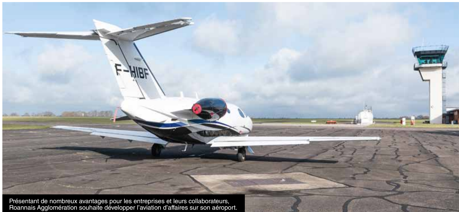
Présentant de nombreux avantages pour les entreprises et leurs collaborateurs, Roannais Agglomération souhaite développer l'aviation d'affaires sur son aéroport.