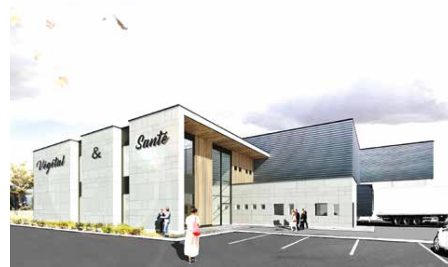
© au'm architectes / aménagements intérieurs : Agro Process

Le nouveau bâtiment abritera les activités « Végétal & Santé » de la Laiterie Collet et devrait créer une vingtaine d'emplois.