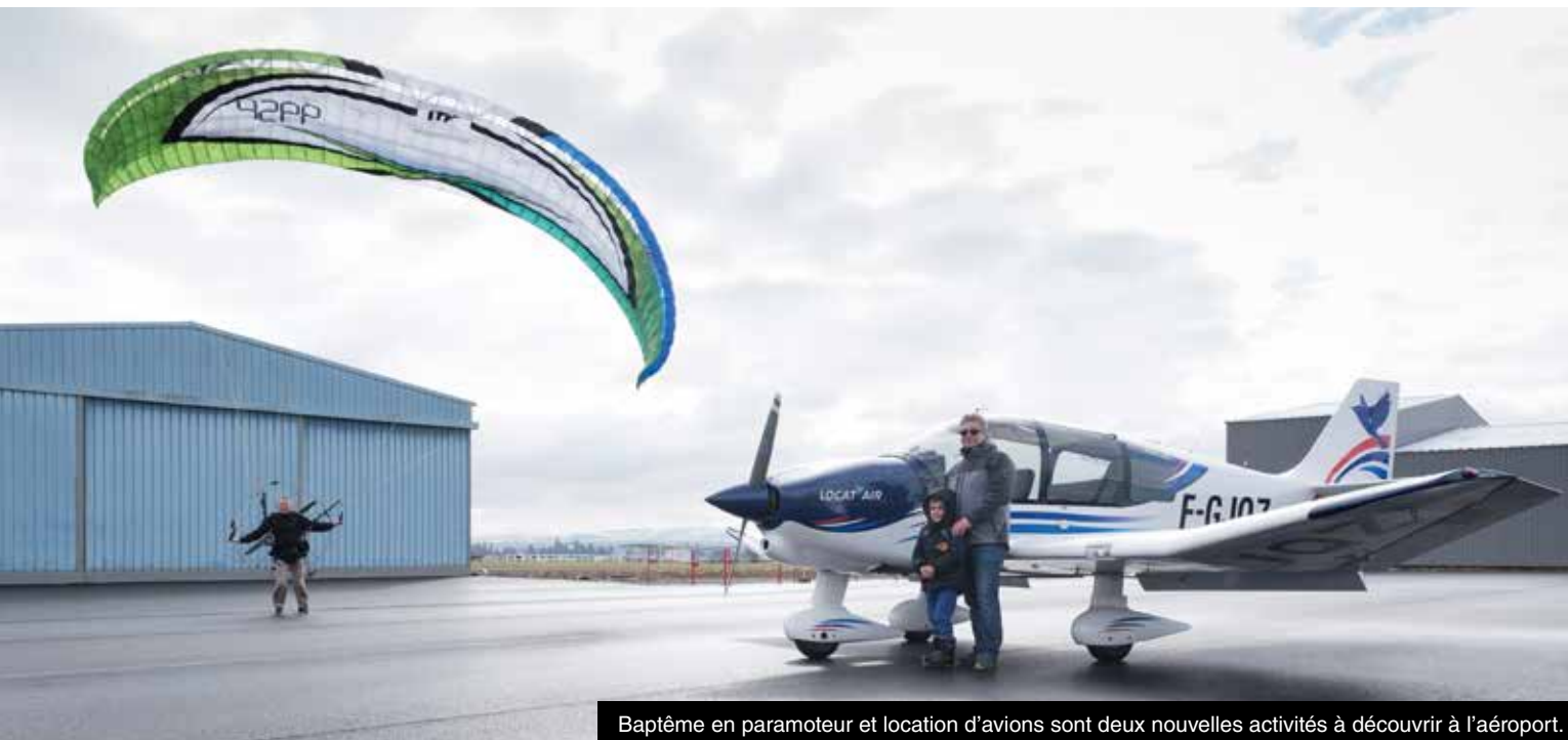
Baptême en paramoteur et location d'avions sont deux nouvelles activités à découvrir à l'aéroport.