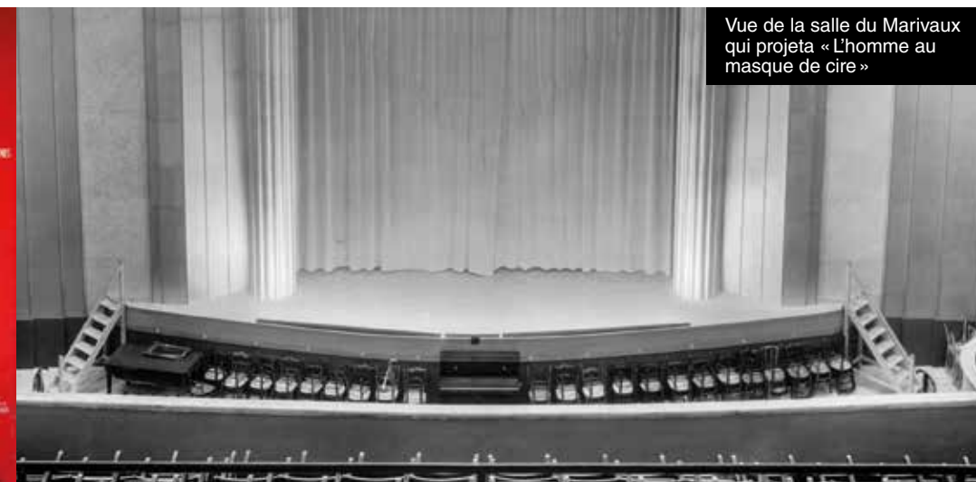
Vue de la salle du Marivaux qui projeta « L'homme au masque de cire »