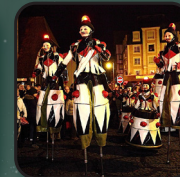
Dimanche 18 décembre LA BRIGADE DES JOUETS Cie Remue-Ménage