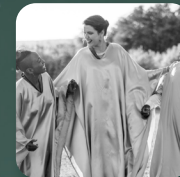
Samedi 17 décembre CONCERT GOSPEL A CAPELLA Association Angel Voice

Les 17, 18, 22, 23 et 24 décembre, des troupes professionnelles sélectionnées lors des plus beaux festivals nationaux déambuleront avec leurs spectacles inédits dans les rues piétonnes. Chaque compagnie offrira deux passages de 45 min à 15h et 17h30 (sauf le 24 décembre, à 11h et 16h30). Au programme : chants, animaux fantastiques, marionnettes gonflées, échassiers... La promesse de moments poétiques !