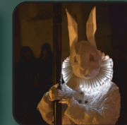
Jeudi 22 décembre LES ANIMAUX FANTASTIQUES Cie Elixir