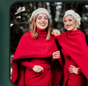
Samedi 24 décembre CHRISTMAS DIAMONDS Afozic