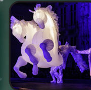
Vendredi 23 décembre FIERS À CHEVAL Cie des Quidams